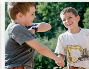
La lutte suisse: un sport plein de rencontres, d'amitiés et de solidarité