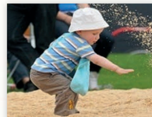
S'habituer très tôt à la sciure