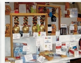
Être récompensé par un superbe prix

Tu trouveras des informations détaillées sur la journée d'initiation à la lutte suisse dans ta région sur le site: www.esv.ch ( Journée d'initiation à la lutte suisse )