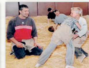
Commencer à s'entraîner à partir de 5 ans