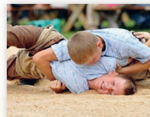
Participer à des compétitions à partir de 8 ans et apprendre différentes techniques