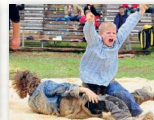
T'imposer en compétition